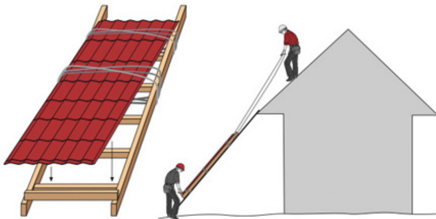
Переноска листов металлочерепицы на кровлю.